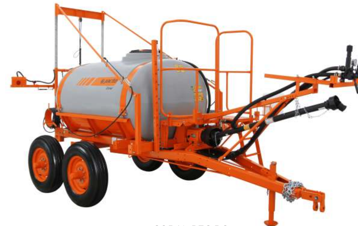
CORAL PEC BC