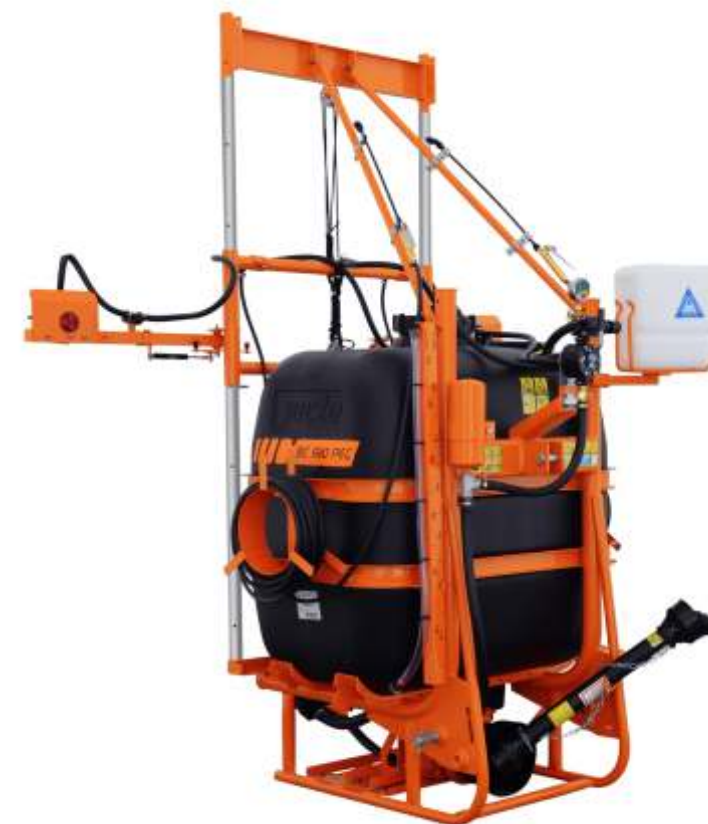
CONDOR BC 610 PEC